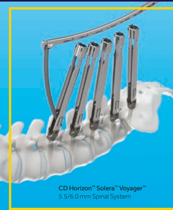
CD Horizon™ Solera™ Voyager™ 5.5/6.0 mm Spinal System

For your minimally invasive TLIF procedures