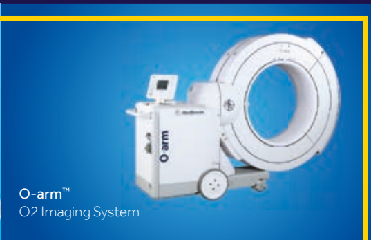
O-arm™ O2 Imaging System