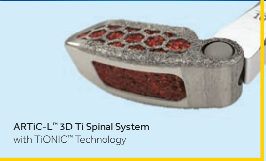
ARTiC-L™ 3D Ti Spinal System with TiONIC™ Technology